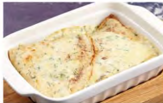
10,6 ЗАПЕЧЕННЫЕ БЛИНЧИКИ С КУРИЦЕЙ И ГРИБАМИ